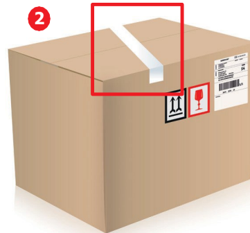
2. Pakkausta ei ole suljettu tarpeeksi tiiviisti.