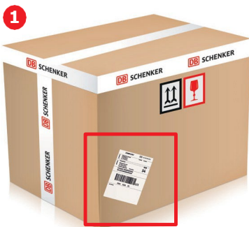
1. Kollisoitelappu on väärässä paikassa.