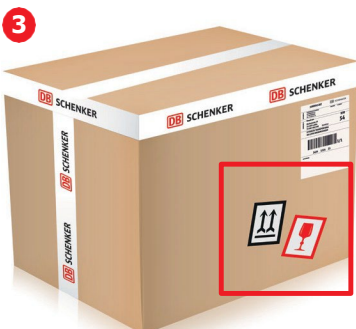
3. Erikoiskäsittelymerkit ovat väärässä paikassa.