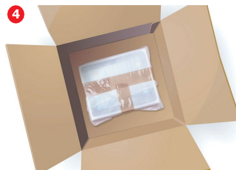
4. Pakkauksen sisältöä ei ole suojattu lainkaan.